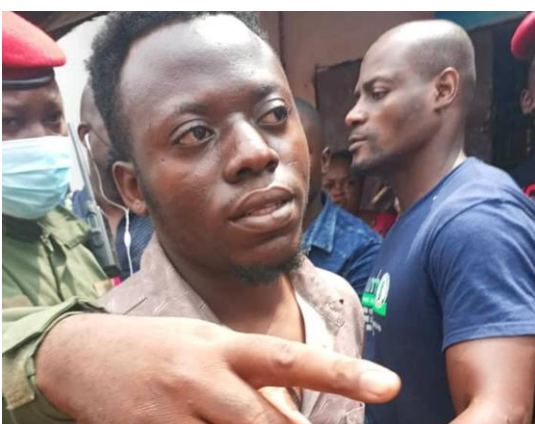
Arrêté à Yaoundé pour trafic transfrontalier (à gauche)