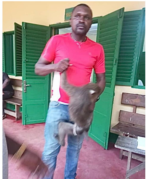
Un mandrill saisi chez un employé de la mairie (en haut et à gauche)