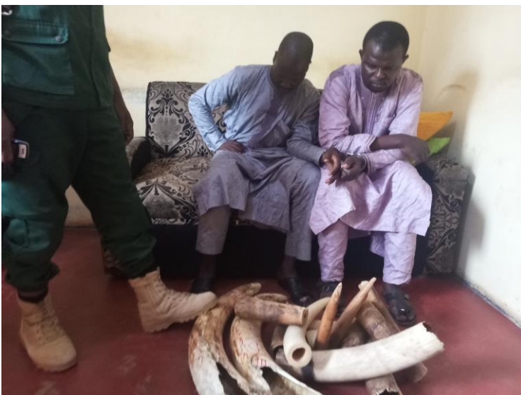
Arrêtés avec 56 kg d'ivoire, les trafiquants au poste de police peu avant la rédaction des procès verbaux.