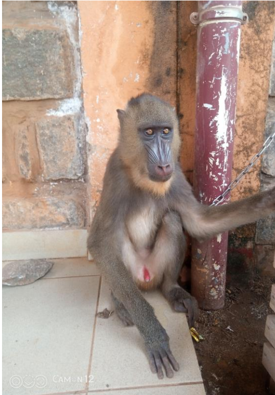
Il a été secouru des mains des trafiquants, au bureau de la faune.