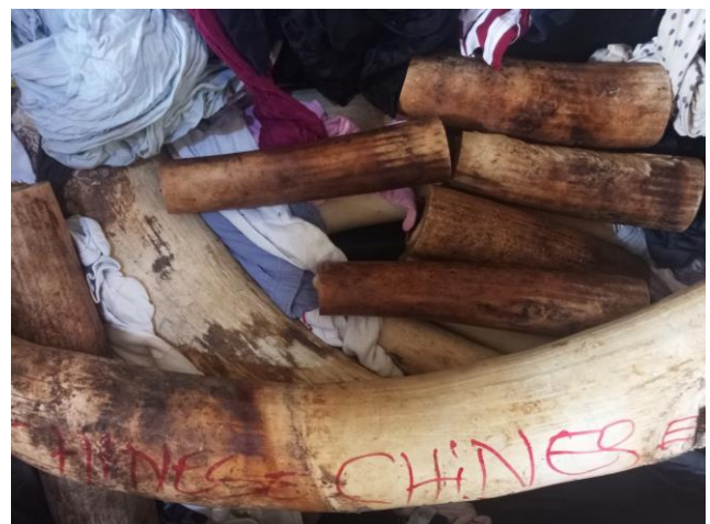
L'ivoire a été dissimulé dans une valise