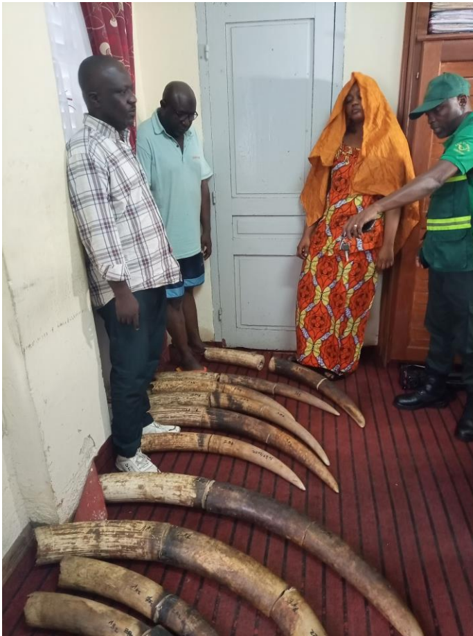
Arrêtés pour trafic de 100 kg d'ivoire