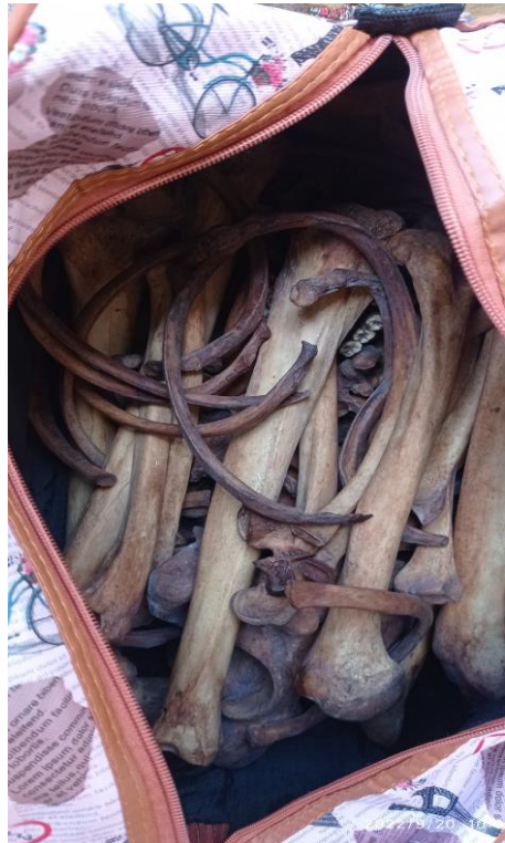
Des ossements humains saisis entre les mains des trafiquants à Douala