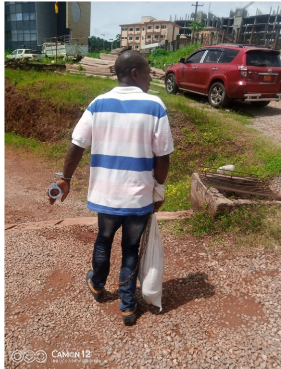
Le mandrill a été transporté dans un sac pour être commercialisé illégalement.