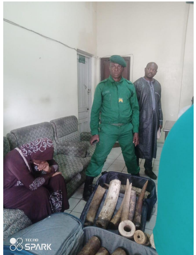
Un agent des Eaux et Forêts avec de l'ivoire saisi