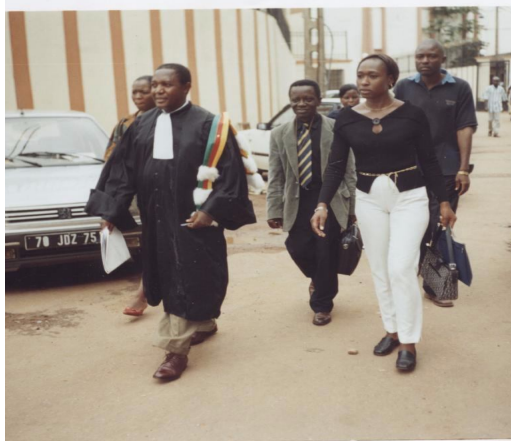
Magistrat en charge de la mise en application de la loi faunique

abattus après obtention d'un titre d'exploitation) en raison du fait que, selon l'article 3 si des mesures de gestion particulières ne sont pas prises, ils deviendraient aussi rares ou menacés d'extinction.