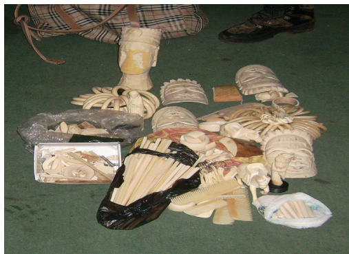
Les prix de l'ivoire sont montés en flèche.

Washington qui a observé que beaucoup de pays africains ont fait des réserves d'ivoire depuis l'interdiction de 1989. Un petit pays comme le Burundi en Afrique centrale a stocké 80 tonnes, en dépit de ce qu'il ne comptait qu'un seul éléphant au moment de