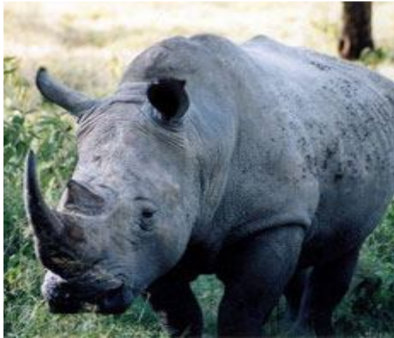
Le rhinocéros noir d'Afrique a-t-il disparu?

Au cours des 150 dernières années, le nombre de rhinocéros a décliné partout en Afrique Centrale. Estimée à 100 000 en 1990, la population de rhinocéros était estimée à 2.400 en 1995. Selon l'UICN « Actuellement, le rhinocéros noir d'Afrique Occidentale a complètement disparu ». Les efforts des experts de la conservation pour l'introduction d'autres sous espèces de rhinocéros en Afrique de l'Ouest font croire que le Rhinocéros noir qui était l'espèce dominante dans la zone a