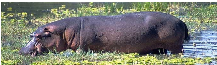
Les Hippos pourront bientôt disparaître