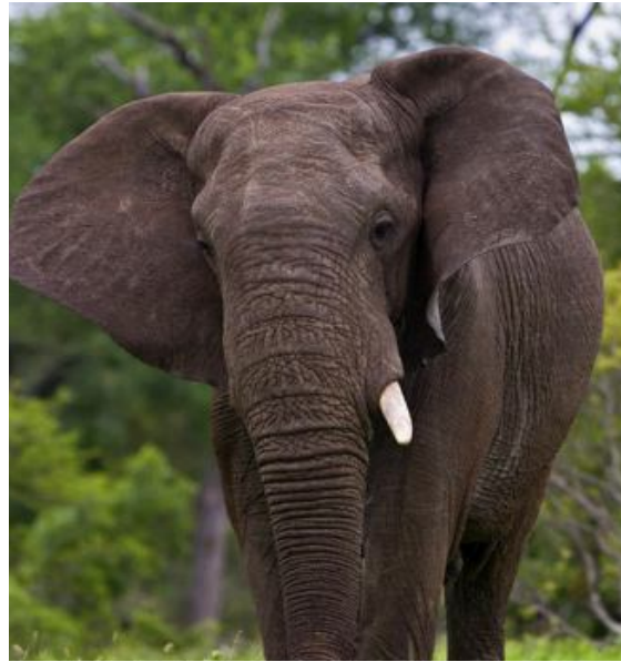
Les éléphants africains continuent à être abattus

L a vie est partout sur la terre et tous les êtres dépendent les uns des autres. Nous dépendons de la nature pour notre nourriture et nos médicaments, pour l'oxygène que nous respirons et les diverses inventions donc nous ventons tant les prouesses. Au cours d'une journée, la population humaine utilise plus de 40 000 autres espèces vivantes. Malheureusement, de l'avis de certains scientifiques, à l'instar de Paul EHRlich Professeur d'études démographiques au Stanford University, avant le milieu du XXIe siècle, l'Homme aura rayé de la surface du globe un quart de toute les espèces. Ce gaspillage du patrimoine faunique entraîne, sur les plans écologique, économique et social de très grandes pertes pour l'Etat. C'est dans cette logique que se situe la création du Ministère des Forêts et de la Faune organe gouvernemental camerounais chargé de veiller à la pérennité de son patrimoine faunique.