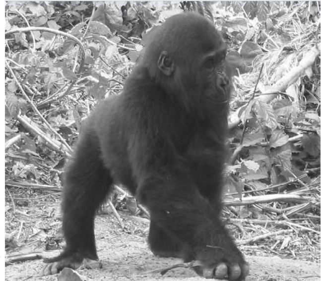
Le grand singe le plus en danger au monde

Les 300 gorilles environ de la Cross River qui