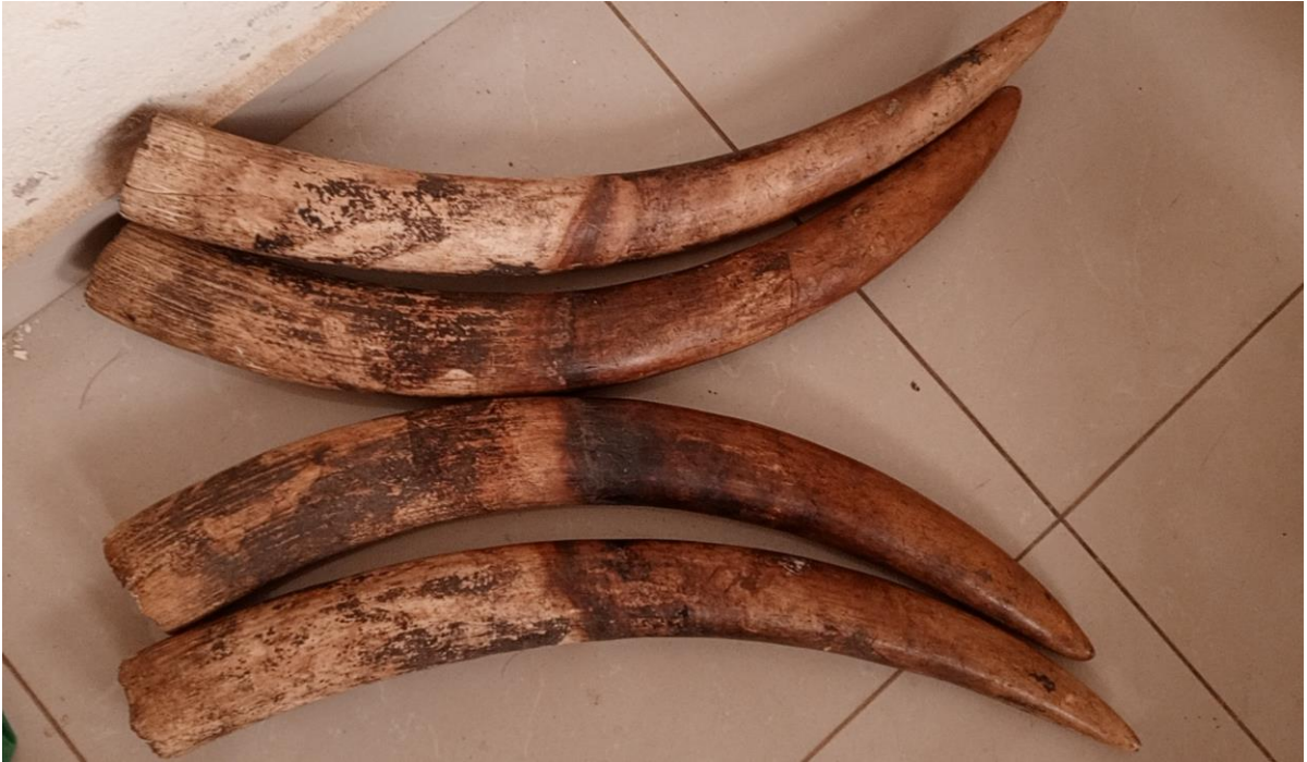
Quatre trafiquants ont été arrêtés avec quatre défenses d'éléphants à Ebolowa, dans la région Sud.